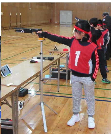
立った姿勢で使う補助台